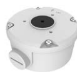
配線ボックス TR-JB05-B-IN 本体希望小売価格 オープン