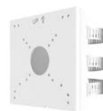
ボール取付金具 TR-UP06-C-IN 本体希望小売価格 オープン