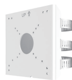
ボール取付金具 TR-UP06-C-IN 本体希望小売価格 オープン