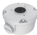
配線ボックス TR-JB05-B-IN 本体希望小売価格 オープン